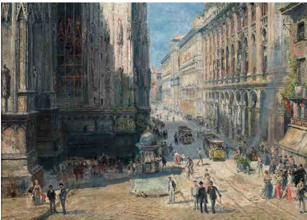
Pierre Henry Theodor Tetar van Elven, View of Milan Cathedral from Corsia dei Servi , 1901, detail