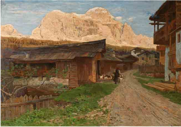
Guglielmo Ciardi, Il Civetta , 1896, detail