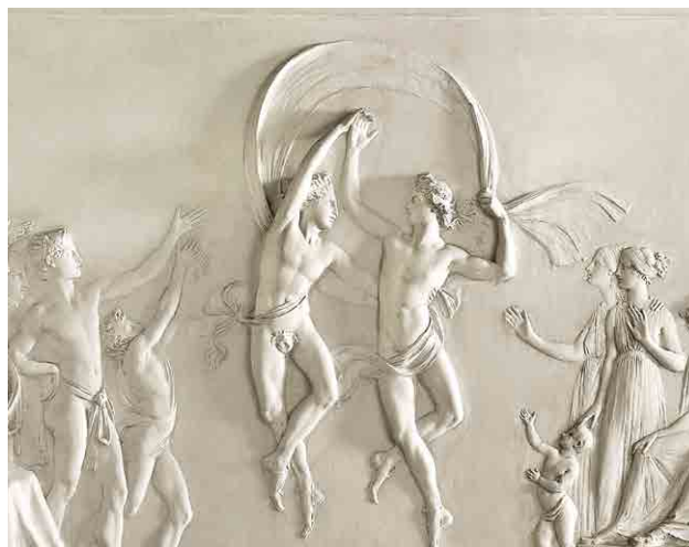
Antonio Canova, Danza dei figli di Alcino , 1790-1792 part.

Una serie di tredici bassorilievi di straordinaria grazia ed eleganza, eseguiti dal "Fidia moderno", rappresentano episodi ispirati dai poemi di Omero e Virgilio e dal Fedone di Platone, accanto alle virtù cristiane e alle opere di misericordia.