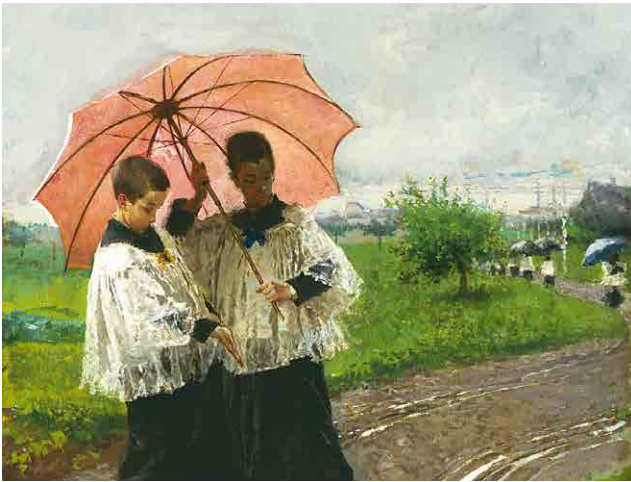
Mosè Bianchi, Il ritorno dalla sagra , 1880, part.