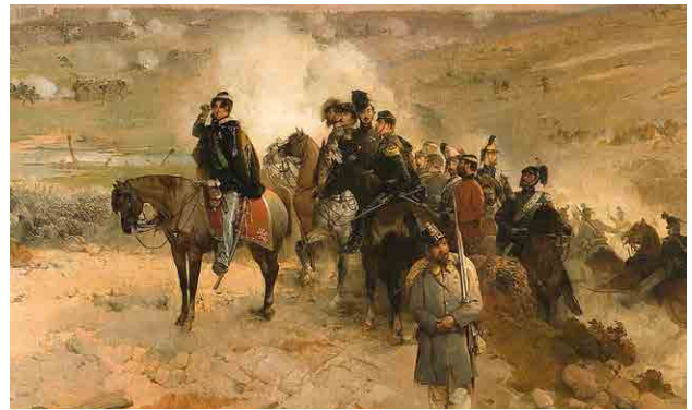
Gerolamo Induno, La battaglia della Cernaia , 1857, part.

Con vivacità e precisione documentaria, i pittori-soldato come Gerolamo Induno e Sebastiano De Albertis restituiscono, nelle loro tele, gli episodi, l'entusiasmo patriottico e la forza epica che hanno segnato la storia risorgimentale italiana.