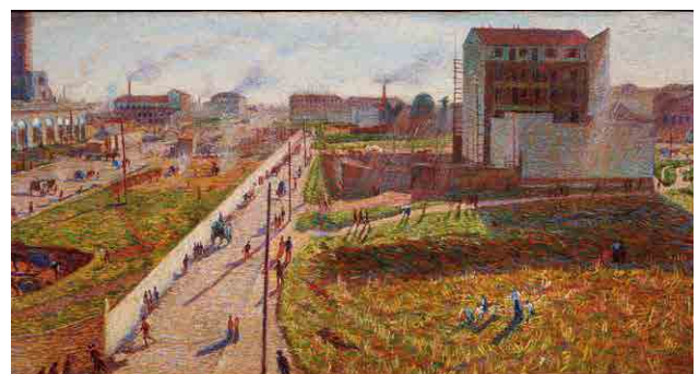
Umberto Boccioni, Meriggio. Factories at Porta Romana , 1910

In this transition between Divisionism and Futurism, as well as the perspective of the paintings the artist also redefines the substance of the painting in a crescendo of signs and timbric harmonies.