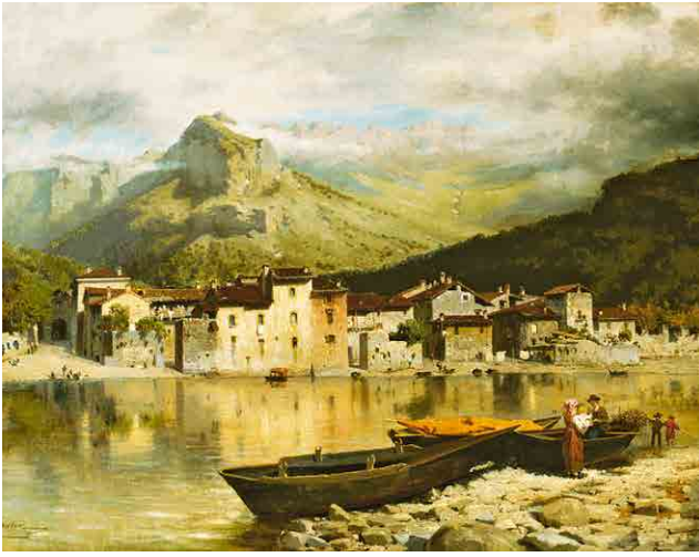
Ercole Calvi, View of Pescarenico from across the River Adda , 1875 ca, detail