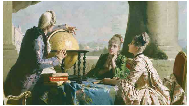
Eleuterio Pagliano, La lezione di geografia , 1880

Tra il settimo e l'ottavo decennio del secolo si assiste a un ritorno d'interesse nei confronti della civiltà del Settecento, e anche in pittura si vedono rispecchiati l'eleganza, il lusso, la libertà di costumi, il disimpegno, la gioia di vivere, l'evasione tipici di quel secolo.