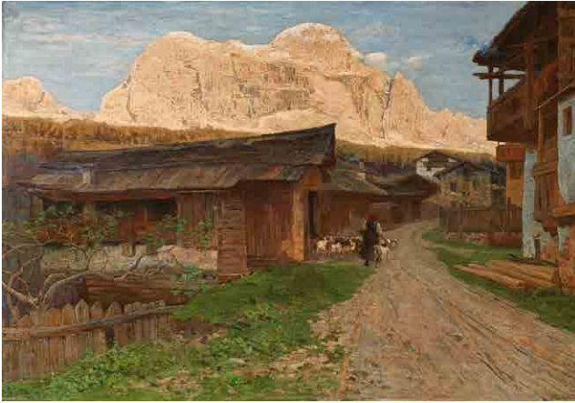
Guglielmo Ciardi, Il Civetta , 1896, part.