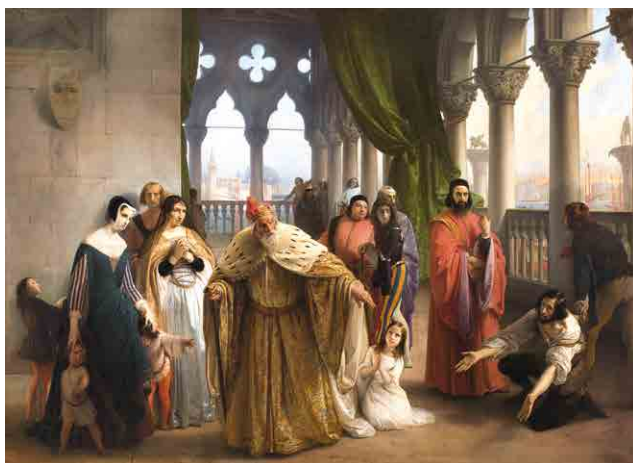
Francesco Hayez, I due Foscari , 1838-1840