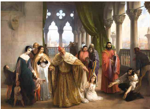
Francesco Hayez, The two Foscari , 1838-1840