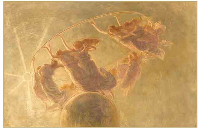
Gaetano Previati, The dance of the Hours , 1899

Incredible works by artists like Leonardo Bazzaro, Angelo Morbelli and Gaetano Previati document the spread and the different forms of Symbolism in Italy between the 19th and 20th centuries: the images of Symbolism end up prevailing over reality, which is transfigured onto a universal plane.