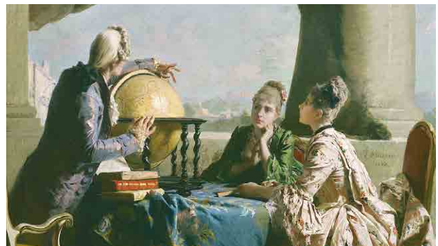
Eleuterio Pagliano, The geography lesson , 1880, detail

Between the seventh and eighth decades of the century there was renewed interest in 18th century life and the elegance, luxury, moral freedom, liberation, joie de vivre and escapism typical of that century are also reflected in painting.