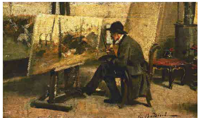
Giovanni Boldini, Ritratto di Fattori nel suo studio , 1866-67, part.

Le opere dei macchiaioli toscani e di altri movimenti di rottura rispetto al Romanticismo e all'arte accademica rinnovano la visione e la riproduzione della realtà attraverso una pittura che, basata sulla sperimentazione della luce e del colore realizzata all'aria aperta, tende a dare più importanza al modo di dipingere che ai contenuti.