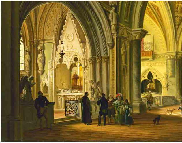
Giovanni Migliara, Inside the monastery in Altacomba , 1833, detail