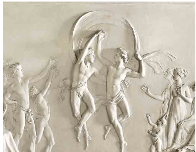
Antonio Canova, Dance of the sons of Alcinous , 1790-1792, detail

A series of thirteen bas-reliefs of incredible grace and elegance, created by the “Modern Phidias”, depict episodes from the poems of Homer and Virgil and from Plato’s Phaedo , alongside the Christian virtues and works of mercy.