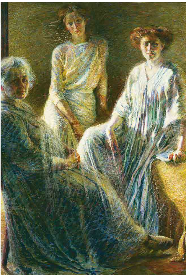
Umberto Boccioni, Three women , 1909-1910