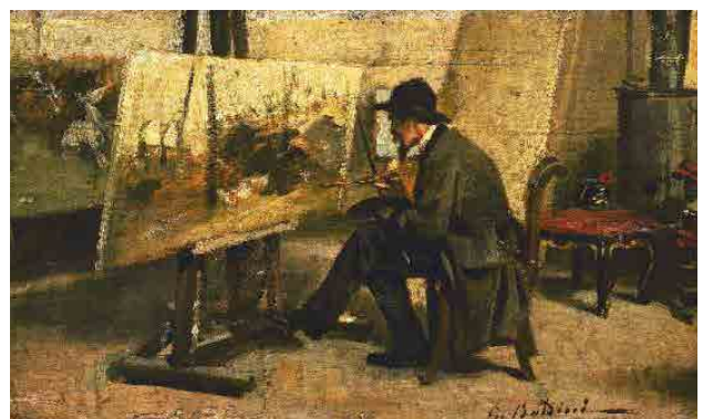
Giovanni Boldini, Portrait of Fattori in his atelier , 1866-67, detail

The works of the Tuscan Macchiaioli and the other movements that broke from Romanticism and academic art offer a new view and depiction of reality through a form of painting which, based on open-air experimentation with light and colour, tends to prioritise the painting technique over the content..