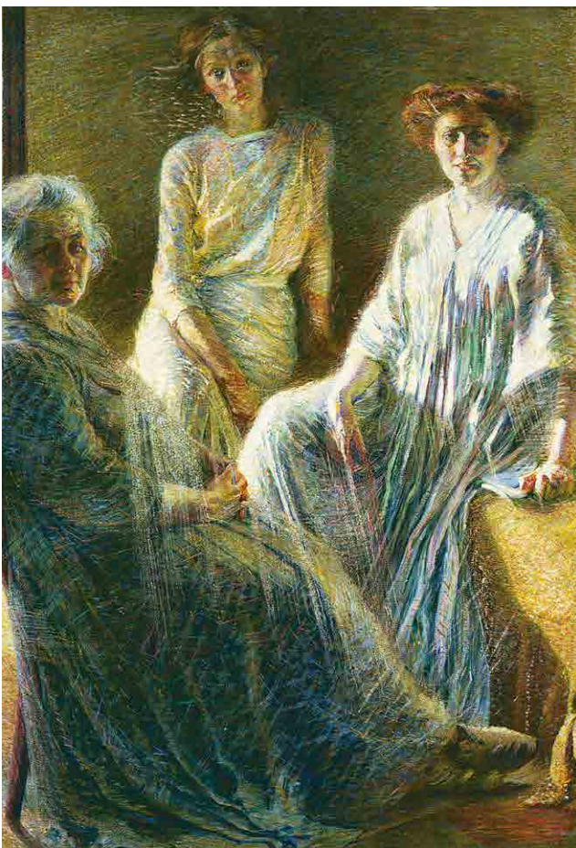
Umberto Boccioni, Tre donne , 1909-1910