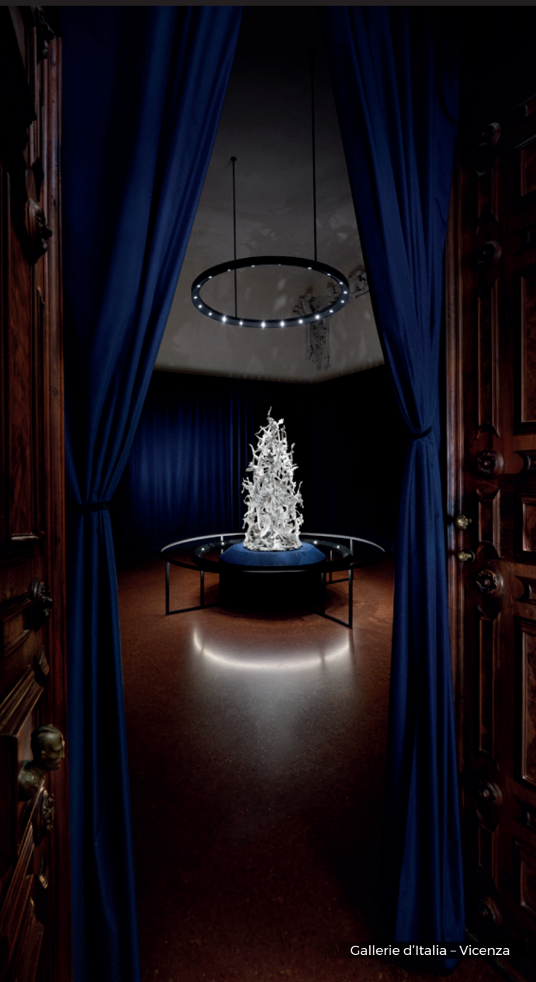
Gallerie d'Italia - Vicenza

Le lezioni sono tenute da accademici di atenei italiani, professionisti, manager della cultura e d'impresa, direttori e funzionari museali. Una faculty che comprova la stretta relazione tra il settore pubblico e il comparto privato quale leva fondamentale di sviluppo ed elemento qualificante per le politiche di tutela, gestione e valorizzazione dei beni culturali.